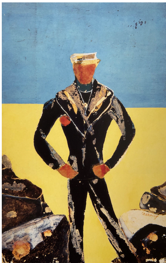
Figura 2 - Mário Cesariny, Pintura (1960). Têmpera e verniz sobre papel colado em platex (36.5 cm x 24 cm). Coleção particular

A presença de um álbum de fotografias dos seus amantes no espólio do artista confirma a relação entre as suas aventuras, o desejo e a representação pictórica, onde podemos encontrar a fotografia que serve de base ao sujeito representado. 57 Nesta oscilação entre o reconhecimento e o apagamento do sujeito, o marujo é desprovido de subjetividade representativa, ganhando um estatuto de símbolo erótico impessoal. Esta leitura permite adicionar dimensões de aventura, errância e estigma que vão estar presentes noutras pinturas em que assistimos a uma maximização do corpo que ocupa a composição, como se verá a respeito das pinturas Figura (1972) ou Sem Título (1982).