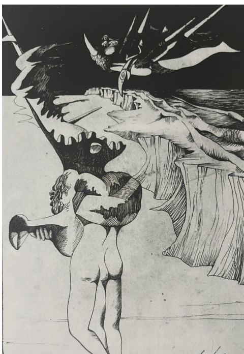
Figura 1 - Cruzeiro Seixas, Desenho (1948). Coleção particular

Desenho , de 1948, é significativo do início de um grande desenhador que explora as ambiguidades como modo de revelar os desejos sensuais e o sentido do maravilhoso. Repare-se na representação das pernas ou no pássaro, ou nas formas agressivas. 27