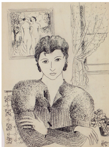
Figura 5 - Ofélia Marques, Autorretrato (1936). Tinta da china sobre papel (30 x 22.2 cm). Fundação Calouste Gulbenkian

interseccional do desejo lesboerótico. A problematização da interseccionalidade vai ser relevante não só para as artistas lésbicas contemporâneas portuguesas que exploram estas dimensões no seu trabalho, 80 mas também para a museologia portuguesa. O Museu Nacional de Arte Contemporânea do Chiado abordou a interseccionalidade dos discursos feministas e feministas queer na exposição “Hetero q.b.” (2013). Impulsionada pela teorização histórica de Judith Butler, a exposição apresenta um conjunto de obras em vídeo realizadas por mulheres artistas, que vão incluir o feminismo histórico e realidades consideradas periféricas ao discurso do feminismo clássico como o lesbianismo e o transgénero. Ao considerarem o enquadramento da heterossexualidade na sociedade contemporânea como normalizador do género, estas artistas abordam novos modelos de sexualidade e o seu enquadramento legal e político, confrontando a complexidade do género. 81