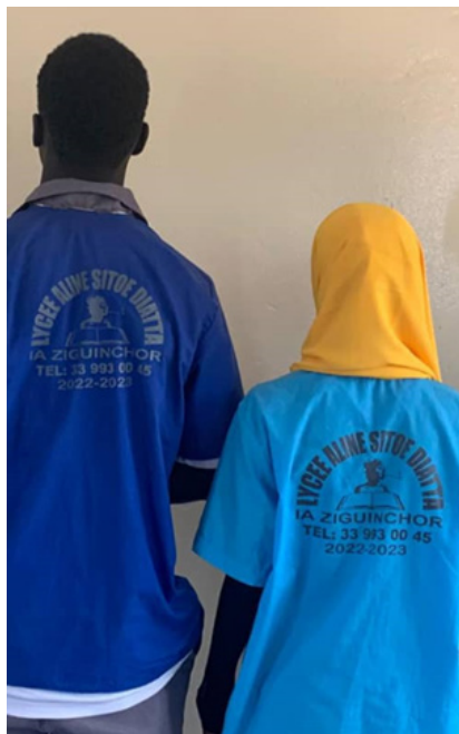
Figura 11 - Foto dos uniformes do Lycee Aline Sitoe Diatta , 13 de novembro de 2024, Omar Sarr Badji (Akil Essuk)

Na década de 1990, pessoas originárias do departamento de Oussouye fundaram uma associação chamada URDO (União dos Nacionais do Departamento de Oussouye em Dakar), cujo um dos objetivos é reunir as diferentes aldeias e cidades do departamento: as competições de futebol organizadas pelos membros desta associação designam-se “torneio Aline Sitoé”.