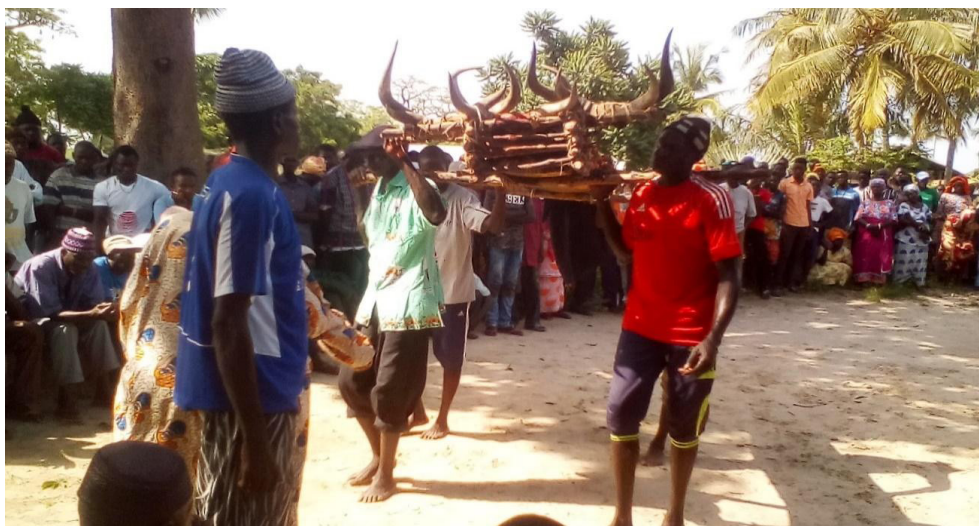
Figura 2 - Um idoso, na frente do falecido e dos caixeiros, fazendo perguntas ao falecido para descobrir as circunstâncias de sua morte

na ilha de Niomoune, no distrito de Ouback (Baixa Casamance), em 2017