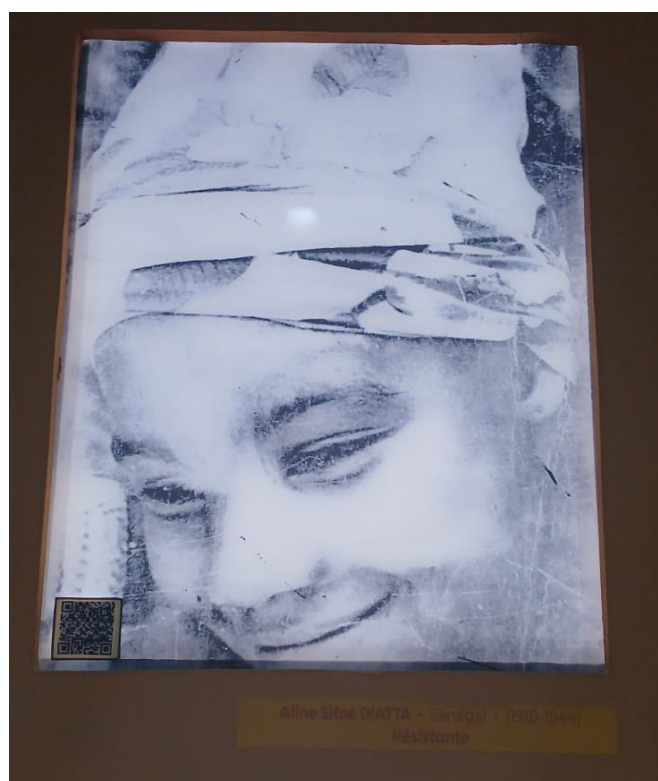
Figura 10 - Foto tirada em 10 de setembro de 2024 por Mariana Bracks Fonseca