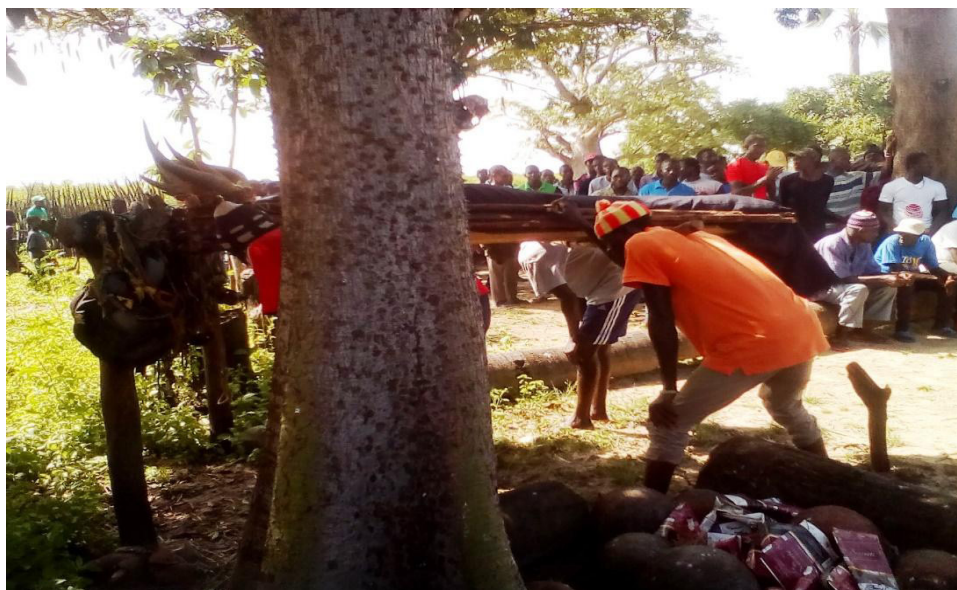
Figura 1 - Ritual de interrogatório. Os quatro portadores do falecido param num altar chamado Djikhindu que desempenha o papel de proteção. Os movimentos são guiados pelo falecido.

Foto tirada por Papis Fall na ilha de Niomoune, no distrito de Ouback (Baixa Casamance), em 2017