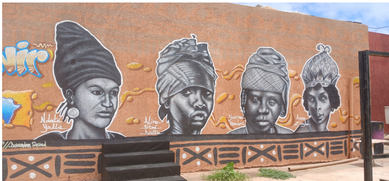
Figura 7 - Foto tirada em 10 de setembro de 2024, por Mariana Bracks Fonseca

Aline Sitoé também aparece em destaque no grande mural à esquerda de quem olha o mar, junto com Ndate Yalla, Yacine Boubou e Njinga Mbandi. A base para essa pintura seria uma outra fotografia de Aline bem jovem, antes de migrar para Dakar, menos comum nas representações que a anterior.