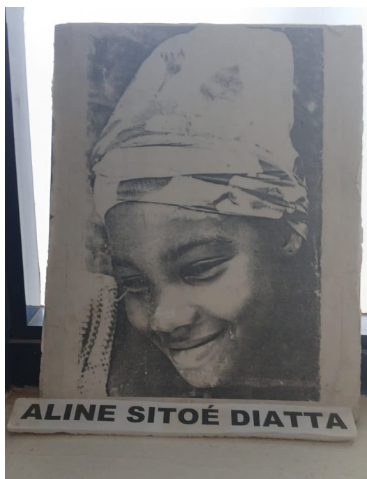
Figura 4 - Retrato de Aline na exposição permanente. Foto tirada em 10 de setembro de 2024

Junto à área destinada a Aline Sitoé há uma instalação artística de Ndate Yalla e imagens em honra a Yacine Boubou e a Ndjembeut Mbodj, Ndatté Yall, Sokhna Diarra Bousso e Sibeth Diédhiou. O museu mostra não apenas as grandes mulheres dirigentes, mas também busca apresentar ao visitante os modos de vida das mulheres africanas, com seus pilões, cauris de adivinhação, trajés e pérolas de sedução, tecidos, formas de carregar os filhos e mais diversos artefatos que nos fazem bem compreender a centralidade do feminino.