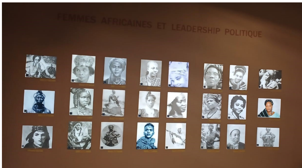
Figura 9 - Foto tirada em 10 de setembro por Mariana Bracks Fonseca