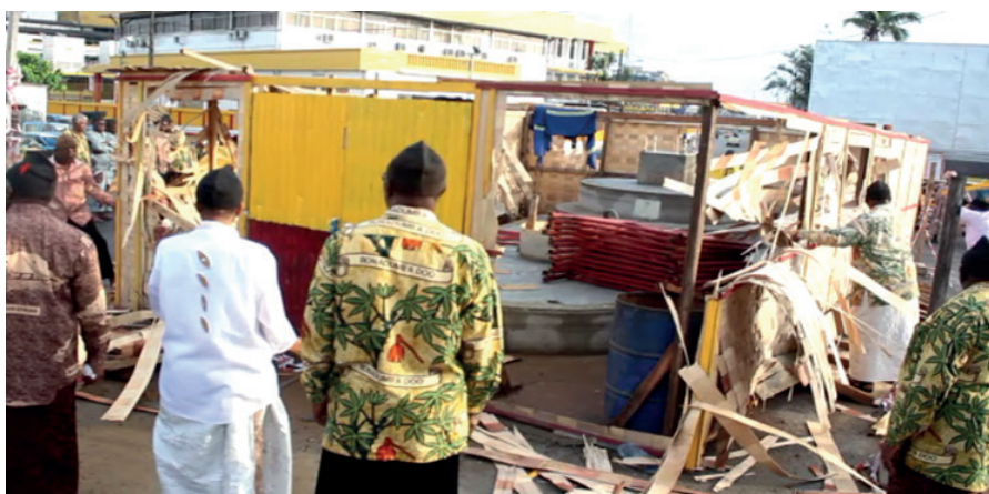
Photo n°3 : La destruction du monument Ruben Um Nyobe par les chefs traditionnels du Canton Bell à Douala

Source : M. Emalé, “ les chefs du canton Bell détruisent le chantier du monument d’Um Nyobe ”, sur www.journalducameroun.com/douala-chefs-canton-bell-detruisent-chantier-monument-dum-nyobe/ , consulté le 10 novembre 2018 à 13h03.